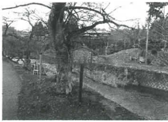
壬申の乱開戦地・藤古川